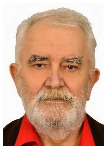
Józek Wójciacyk Region IPA Kraków